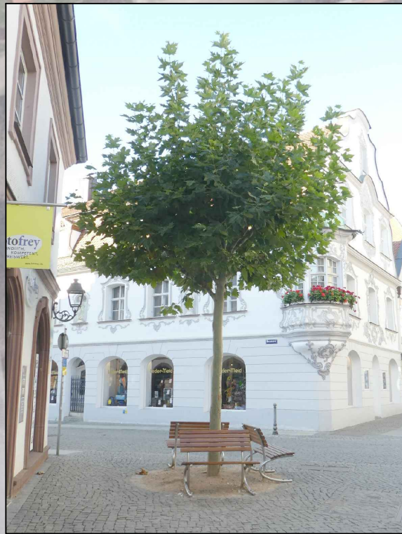
Fortsetzung der Kandelaberplatanen in der Fußgängerzone