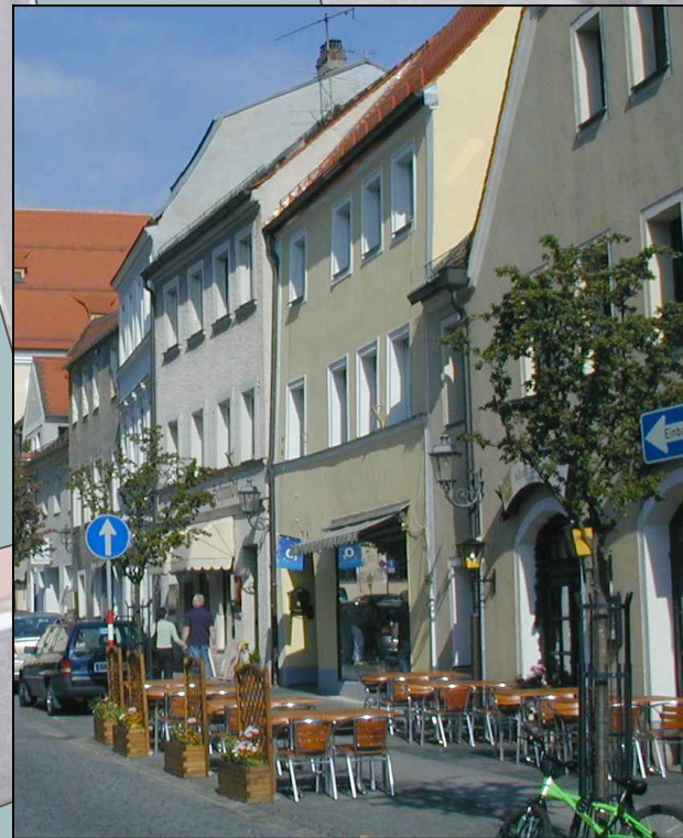
Derzeitige beispielhafte Außengastronomie