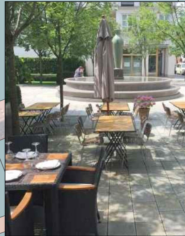
Beispiel für Außengastronomie